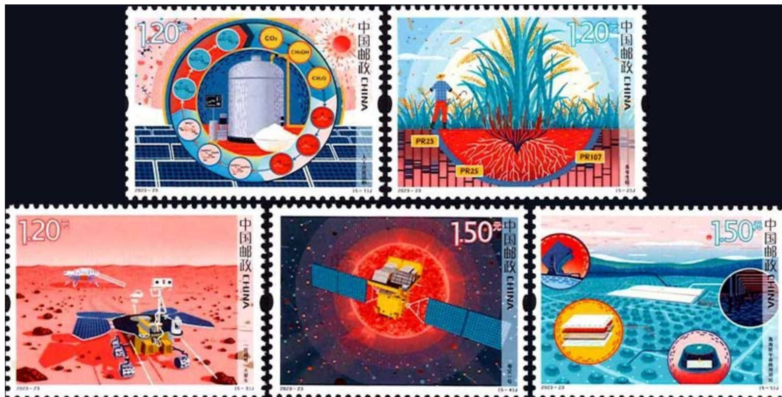
中国 科学技术革新 上段左は人工合成澱粉